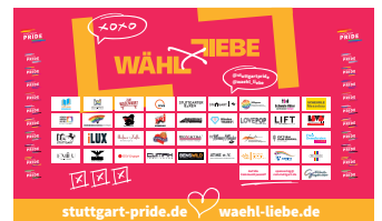
Community-Wand V1 2025 „Wähl Liebe“